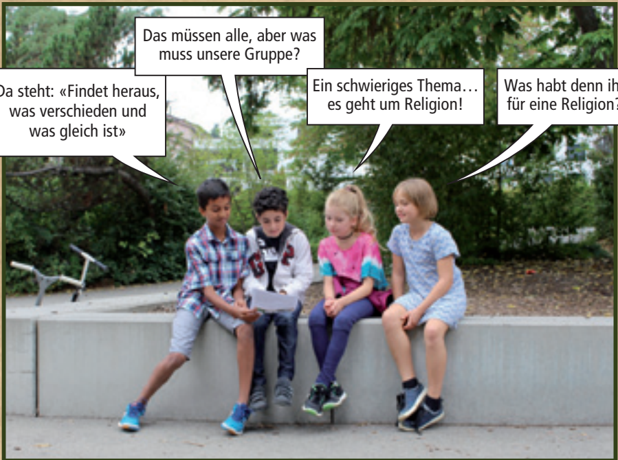
AUF DEM PAUSENPLATZ...

Das müssen alle, aber was muss unsere Gruppe?